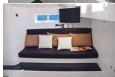
Toujours dans la cabine arrière, un canapé confortable fait face au lit double.